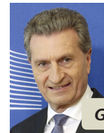
Günther H. Oettinger